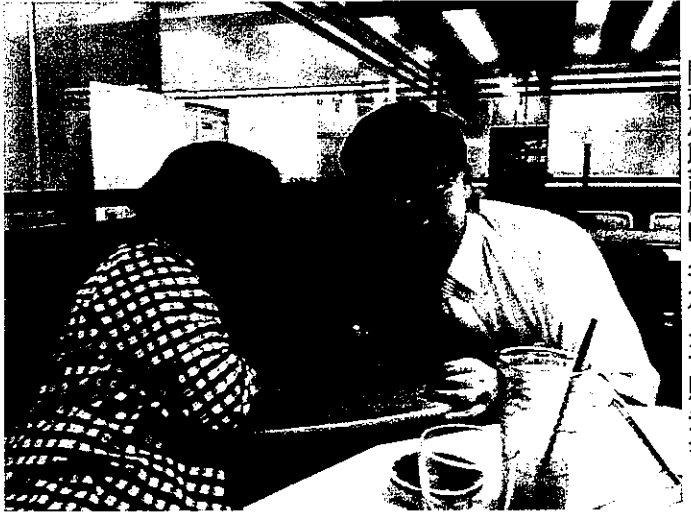
問政之餘舒壓的良方便是含貽弄孫

想著：「到底是他們與我們一樣？還是我們與他們一樣？」 提到經金廈小三通到湄洲媽祖進香，讓筆者想起，當時晉章理事長在台大讀研究所，我們是星期四啟程前往，而他在星期六有課，所以星期五我們去湄洲之後他即脫隊趕回台北